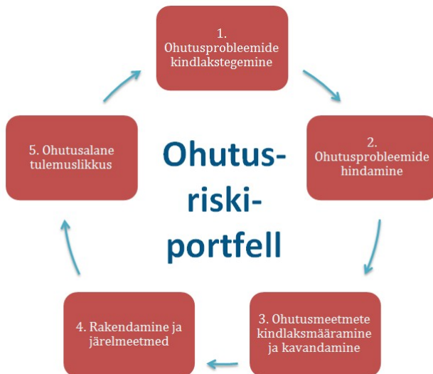
Joonis 2. Ohutusriskiportfell

Ohutusprobleemidele tuleb läheneda süsteemselt järgides SMS-i ohutusriskiportfellis kirjeldatud põhimõtteid (joonis 2).